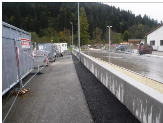
Bild: Zustand nach Bau der Maßnahme

Maßnahme: Am nördlichen Ufer der Donau schützt eine Hochwasserschutzanlage das Gewerbegebiet. Im ersten Abschnitt zwischen dem Kreisverkehr der L443 und der Lippachbrücke wurde ein Deich hergestellt und die Erschließungsstraße darauf gelegt. Die Brücke wurde als zweiter Abschnitt erneuert und erhöht. Im dritten Abschnitt wurde mit Betonelementen, Dammbalken und Deichabschnitten der Bereich am städtischen Bauhof und Wertstoffhof geschützt.